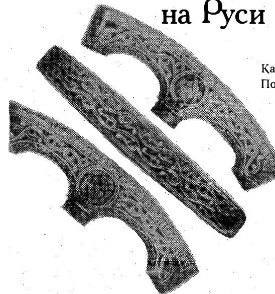
Казнь стригольников. Посох Стефана Пермского